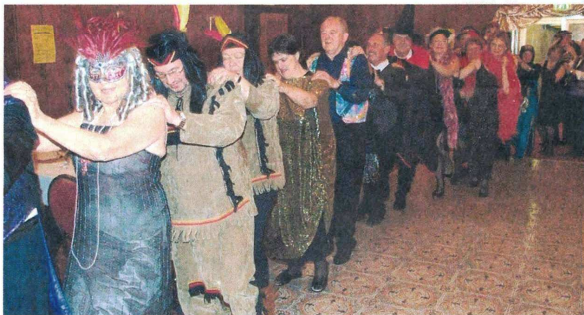
Auch eine lustige Polonaise gab es beim Sängerball im Hotel Zeller.