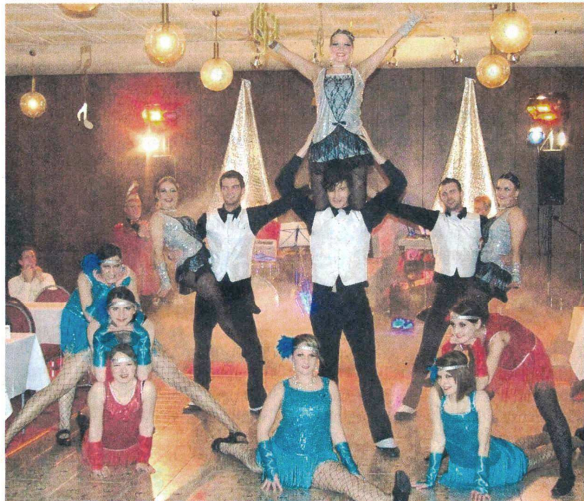
Die Showtanzgruppe aus Untermeitingen unterhielt die Gäste beim Sängerball des Gesangvereins Liederkranz.

Immer wieder lockte die Band „Die Nachtschwärmer“ auf die Tanzfläche – manche bis zur Erschöpfung in den frühen Morgenstunden.