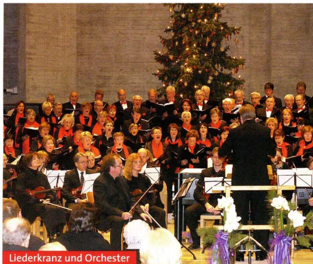
Liederkranz und Orchester