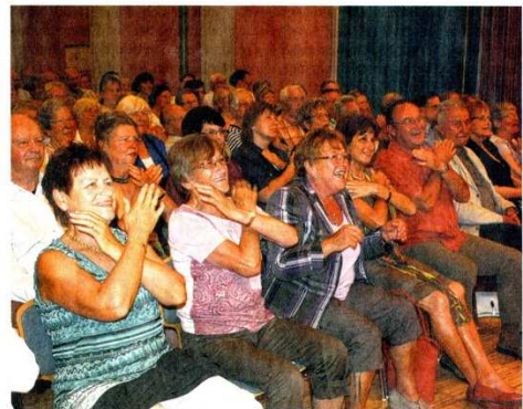
Gut gelaunt begleiteten die Zuhörer mit Armbewegungen den Chor bei einem Lied der eingeborenen Maori aus Neuseeland.